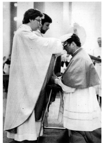
Foto: Neupriester W. Onizazuk spendet Kardinal Meisner den Primizsegen

2013 berief ihn der damalige Erzbischof in das Metropolitankapitel bei St. Hedwig, dem er seit dem als nichtresidierender Domkapitular angehört.