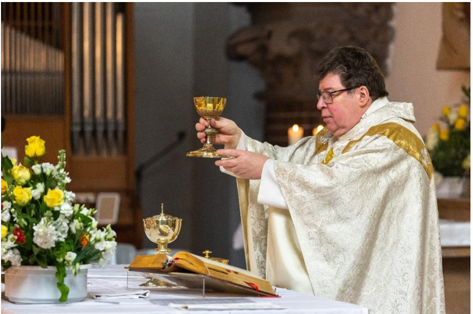
Erstkommunion 2023 in St. Pius